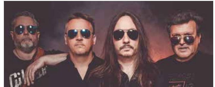
Rockcover von Cunnig Stuff